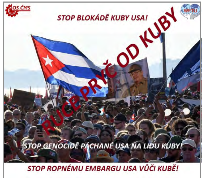
Foto z oslav 1. máje 2026 v Havaně.